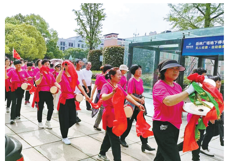
“我的名字叫坚强！”近日，奉化区癌症康复协会的200余名会员齐聚奉化岳林广场，开展了气势雄壮的“健步走”活动，为全国肿瘤防治宣传周造势。