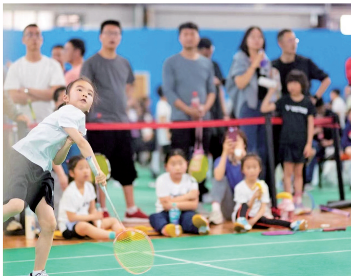
宁波小球员在各大赛事中崭露头角。