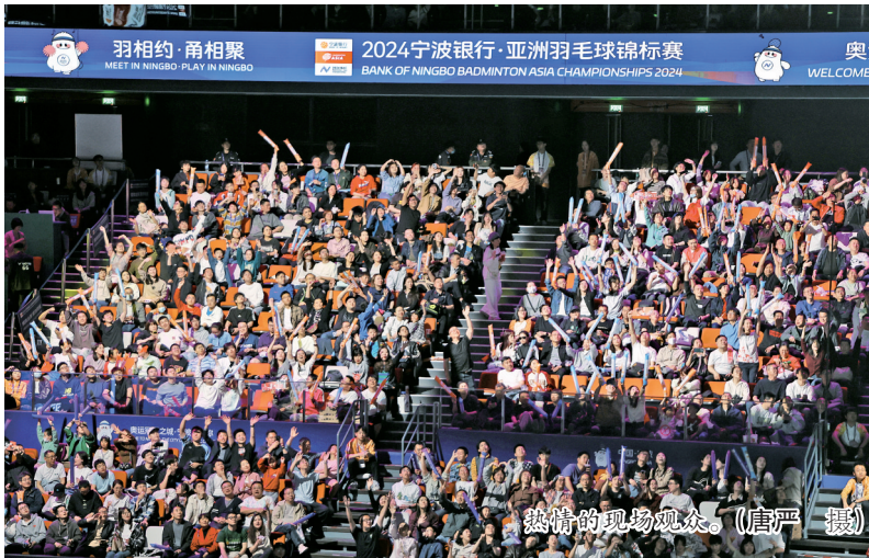
热情的现场观众。