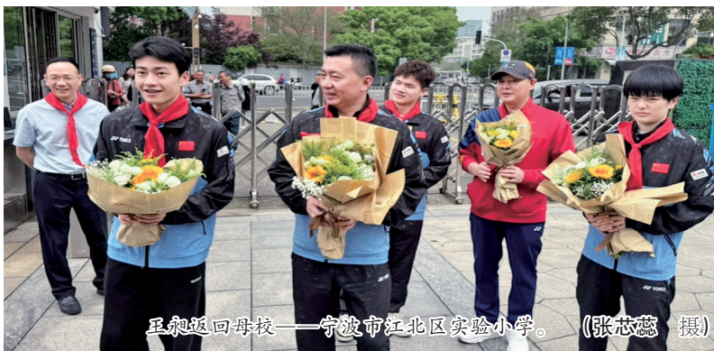
冠军返回母校——宁波市江北区实验小学。