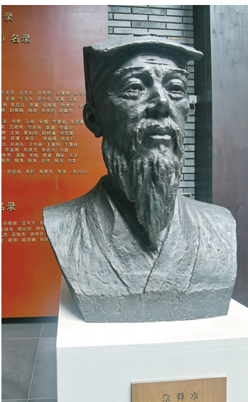
余姚名人馆内的朱舜水像

1659年，朱舜水赴思明州（今厦门）参加郑成功的北伐军，兵败后，退至舟山。为了保全名节，朱舜水乘坐日本商船逃往长崎。