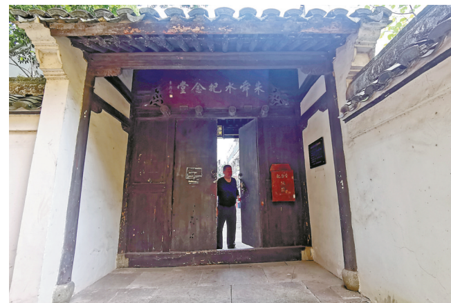
在龙泉山南麓的朱舜水纪念馆

学者，在当时的学术背景下或多或少继承了“程朱”或“陆王”的部分理念。可以说，朱舜水既吸收了朱子学的“格物致知”“内圣外王”，又吸收了阳明学的“事上磨练”“知行合一”，因此形成了“实功实学”的思想学术理念。