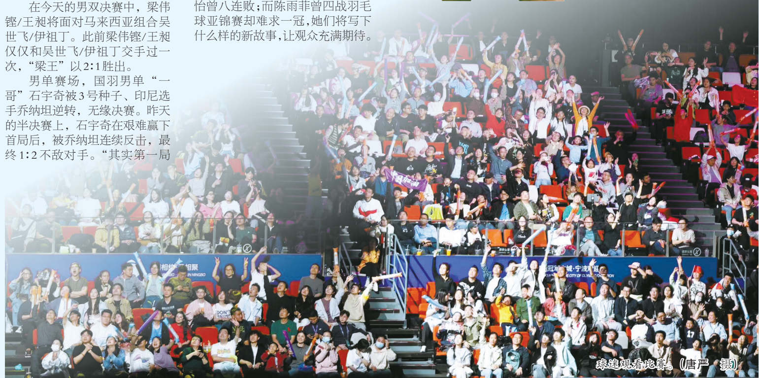
球迷观看比赛。