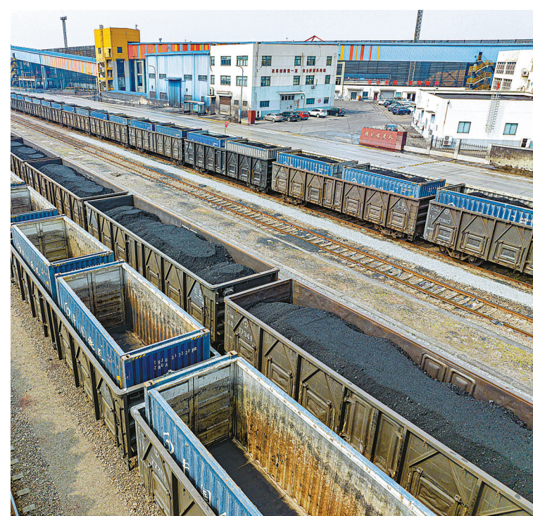
镇海港区煤炭疏运现场。