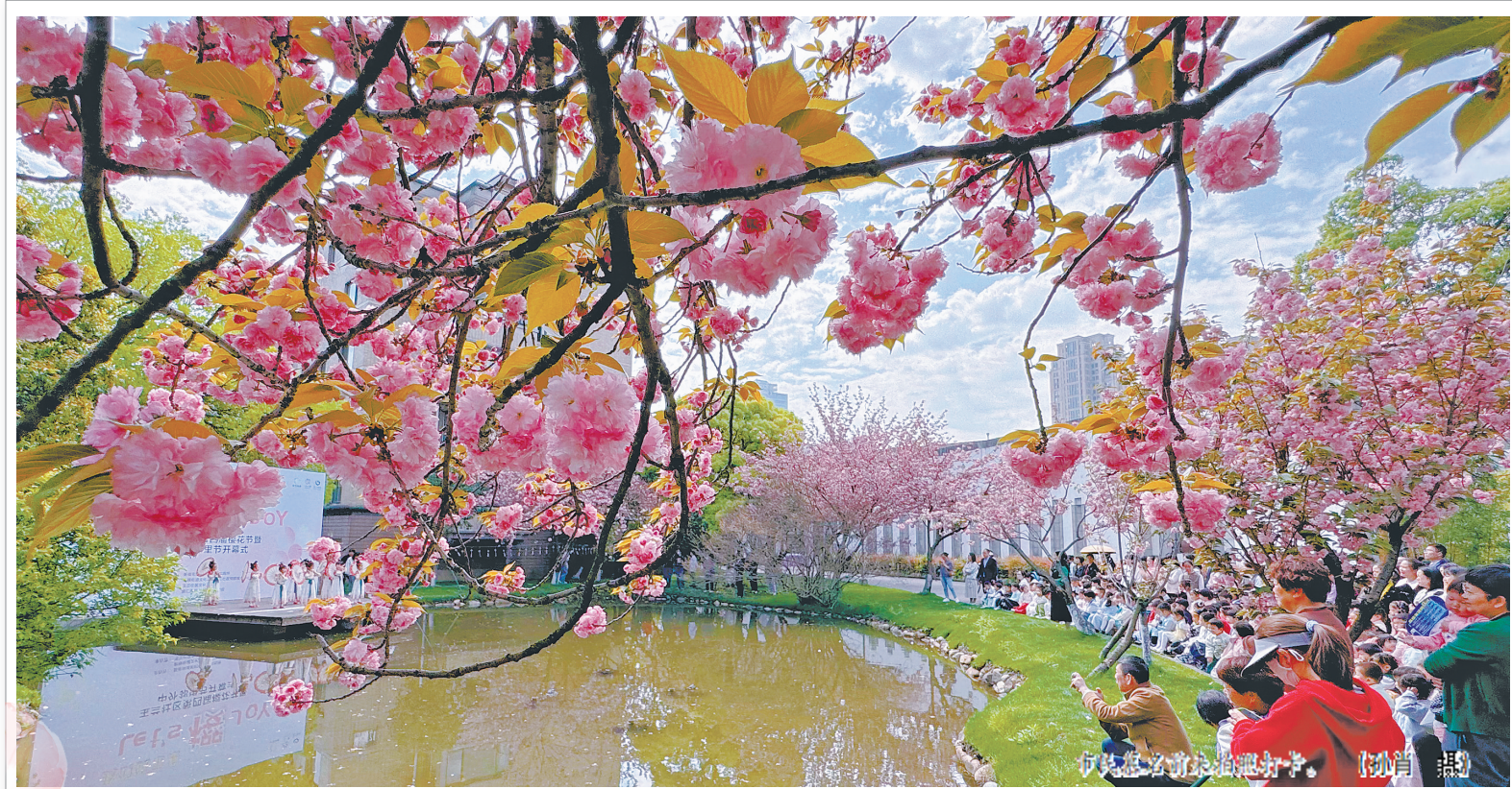
樱花节吸引了众多打卡。

昨日是三月三上巳节,一场女子及笄礼体验活动在天一阁举行。活动生动还原了传统成人礼——笄礼,展示中华礼仪之邦的风范与魅力。现场,有不少游客被现场的氛围吸引,纷纷驻足观看。