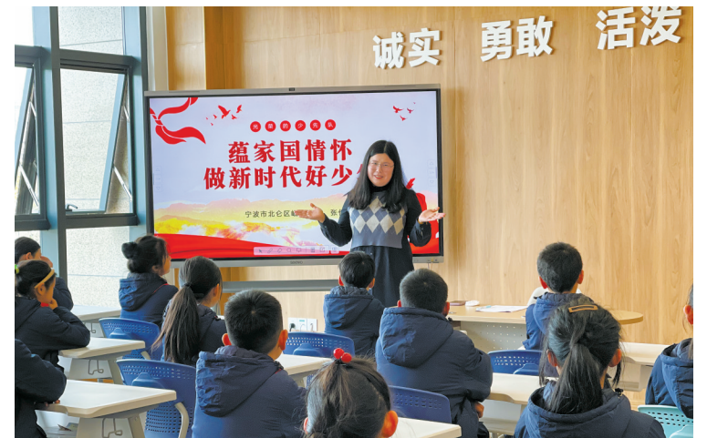
“蕴家国情怀 做新时代好少年”少先队活动课在春晓街道“红领巾学院”开讲。

当天下午,2024年市政府民生实事项目“家门口青少年宫”项目启动仪式在北仑区春晓街道洋沙山社区“家门口青少年宫”举行。据了解,“家门口青少年宫”建设也是推进浙江省现代化社区建设“十件惠民好事”之一,旨在构建普惠均衡的青少年校外活动阵地,发挥青少年宫优势,推动师资、课程等下沉,把青少年宫建到社区里,让更多青少年在“家门口”享受优质教育资源。