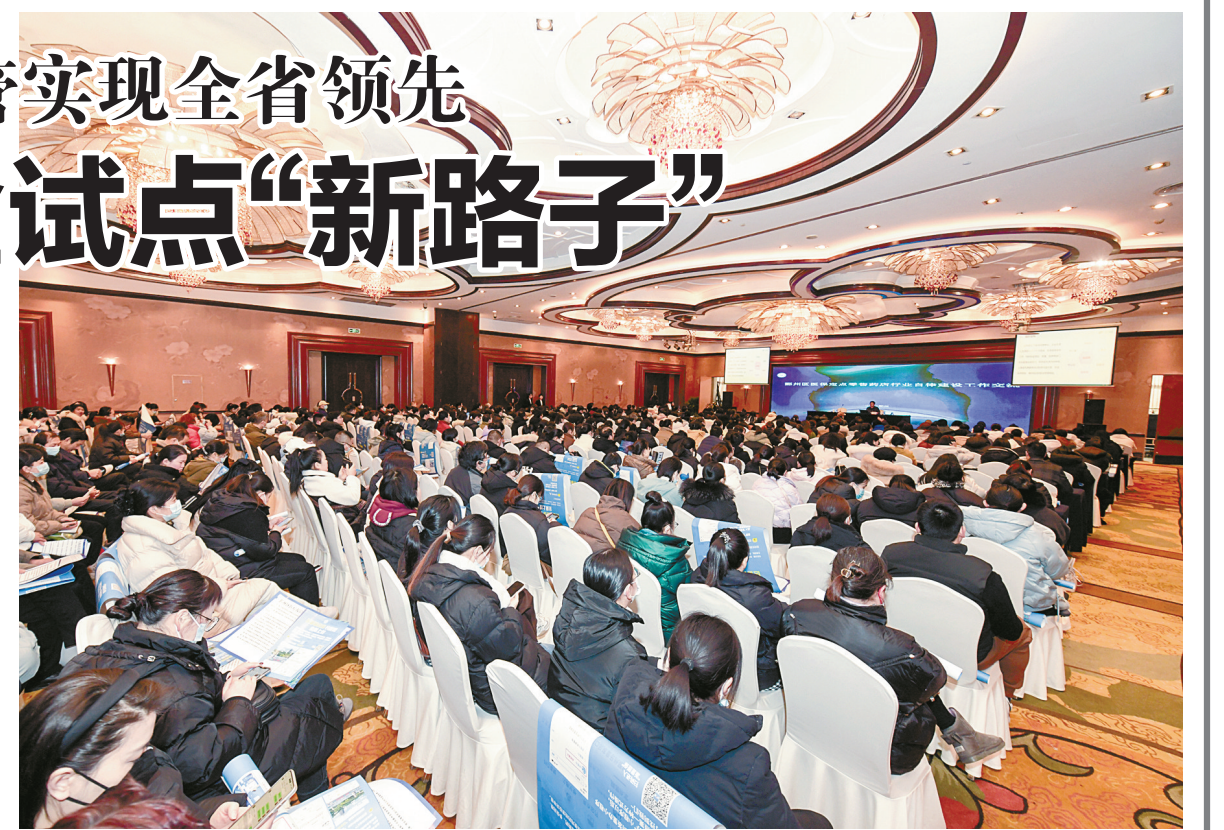
鄞州区医保局开展医保定点零售药店行业自律交流。

为鼓励群众参与医保基金监管，鄞州区医保部门根据省里规定，制定了《鄞州区医保基金举报奖励管理暂行规定》，细化了奖励标准、奖励条件、奖励程序，明确了领奖流程，开辟兑付渠道。“畅通举报渠道，落实奖励制度。希望能通过这种方式，营造出人人参与基金