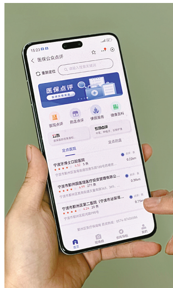
参保人就诊后，登陆“医鄞保点评”系统对医院进行点评。

定点医药机构数量占全市20%，拥有全市最多的定点医疗机构和零售药店，面对大量医保基金使用主体，鄞州区采用“协议管理+行业自律+查漏补缺”的形