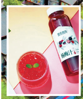
慈溪产物梅汁。