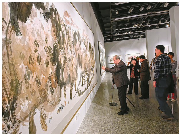
展览现场。