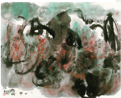
《风行图》纸本水墨 2016年