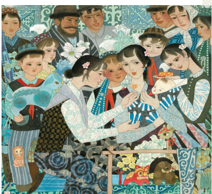
《满月》绢本工笔重彩 1981年