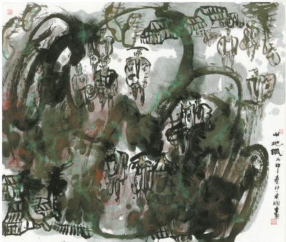
《山地风》纸本水墨 2016年