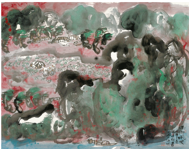
《南乡风暖》纸本水墨 2016年