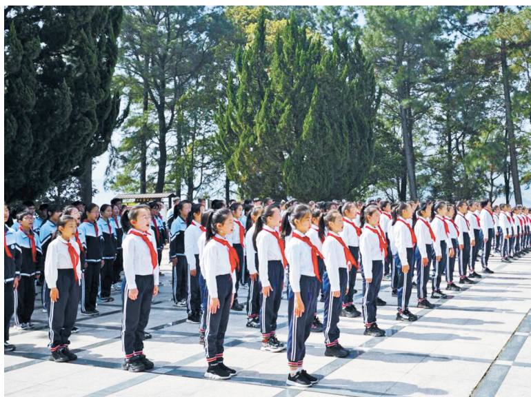
在余姚四明山革命烈士纪念馆前，200余名小学生献唱《我们是共产主义接班人》。

随后，学生们参观了四明山革命烈士事迹陈列馆，部分学生赴横坎头村新时代文明实践站溯源参观。 据悉，活动由市退役军人事务局、市文明办、市教育局、团市委、市关工委联合组织实施。根据计划安排，全市中小学还将在清明假期开展英烈主题班会、红色宣讲、网上祭奠等活动。