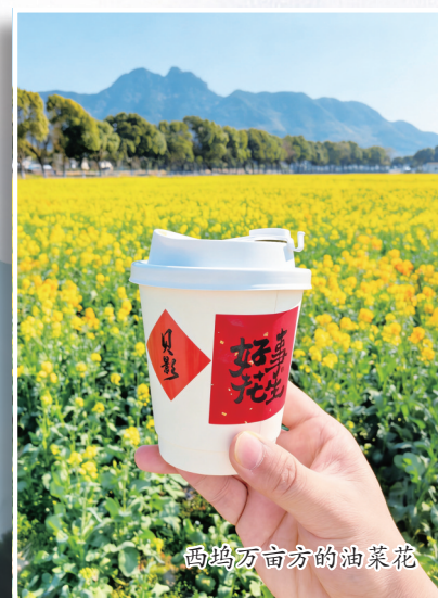
西坞万亩方的油菜花

花开有期,春风有信 奉化的花海,开在山野、漾在田垄、漫在溪畔 以万般芳菲,揽尽春日盛景 候君赴一场春日花事之约 共赏一城繁花,共赴一季温柔