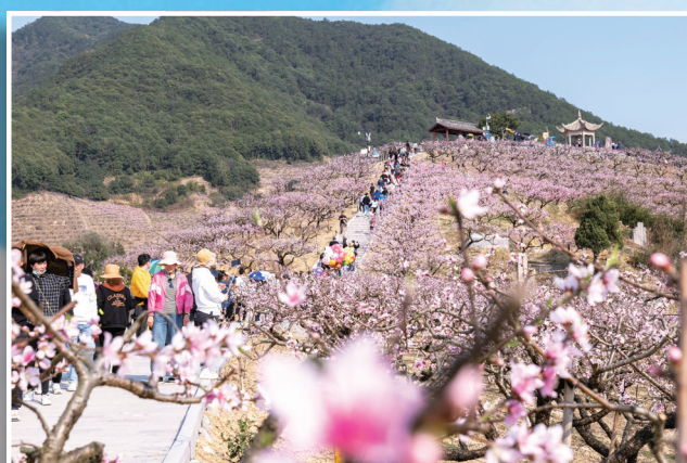
林家村的桃花