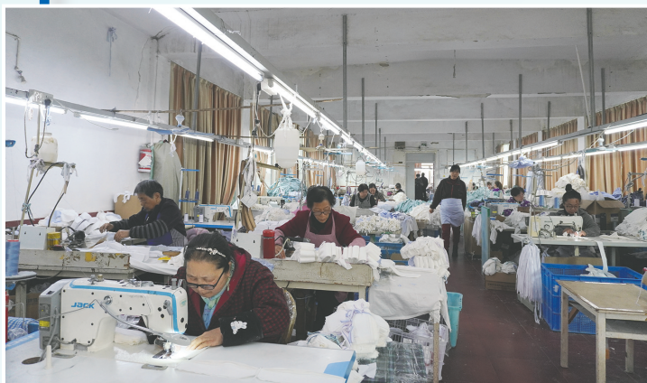
宁波皓天服饰有限公司全力赶制新春首批海外订单

一批重点企业、重点项目加快复工和建设进度,为全镇工业经济注入了强劲动力。从机器换人的技改现场,到赶制订单的生产一线,裘村镇上下正以龙腾虎跃、鱼跃龙门的干劲闯劲,掀起了新春生产热潮,奋力跑好全年开局“第一棒”,为谱写丙午马年高质量发展新篇章蓄势赋能。