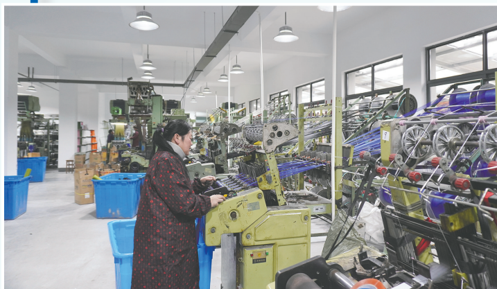
宁波上优织造有限公司工人忙碌有序