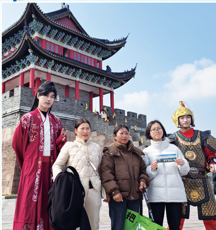
游客在黄贤森林公园登高祈福