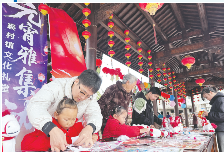
马头村老少同乐共制元宵花灯