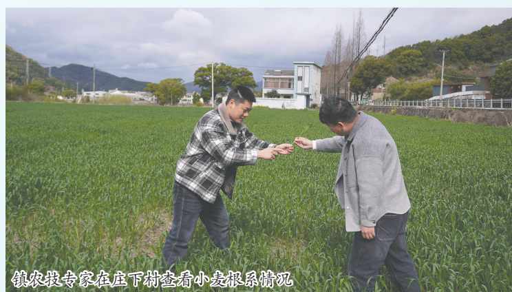
镇农技专家在庄下村查看小麦拔节情况

据了解,裘村镇今年种植小麦1500余亩,以稳面积、优技术、强保障为抓手,全力实现粮食生产“开门红”。镇农办负责人表示,将持续做好中后期田间管理,防范“倒春寒”和病虫害风险,让千亩麦田成为乡村振兴的“希望田”。