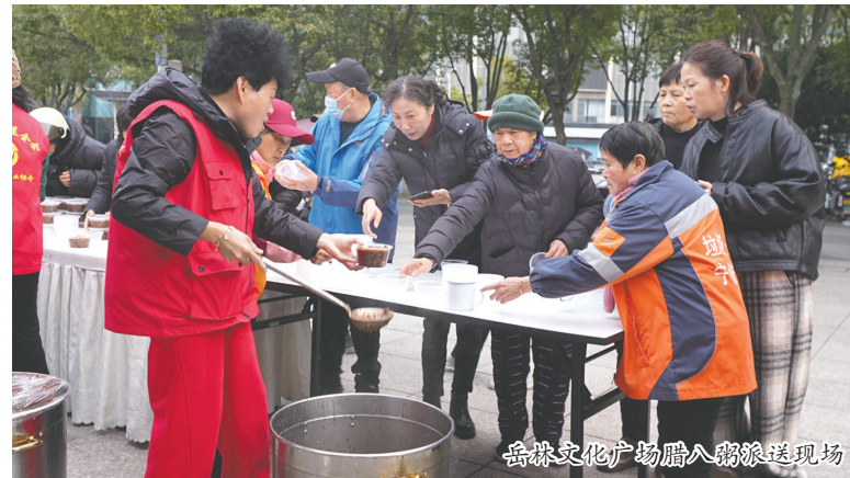
岳林文化广场腊八粥派送现场

本报讯(记者 康诗文 何腾涛)腊八节至，粥暖人情。昨天，区慈善总会联合区餐饮行业协会共同发起“群立方 促共富——一碗腊八粥，温暖一座城”腊八节主题活动，将18000碗精心熬制的腊八粥送至城市各个角落，以传统美味传递节日温情，为寒冬增添融融暖意。