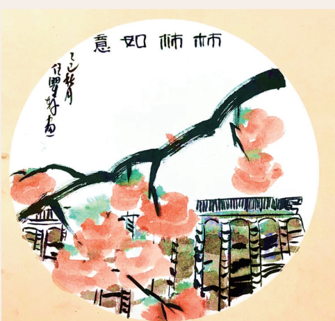
“柿柿”如意 莼湖中心小学205班小记者 任翟轩 指导老师 张剑华