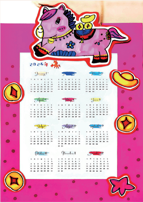
马年挂历 西坞中心小学103班小记者 郭羽洁 指导老师 张静波