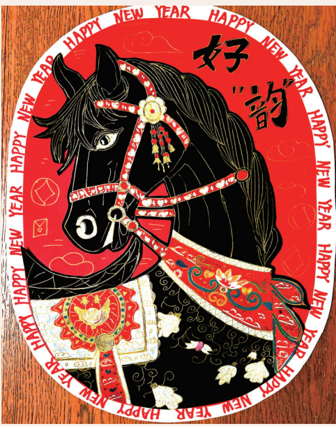
马年好“韵” 实验小学408班小记者 毛韵茹 指导老师 毛丹丹