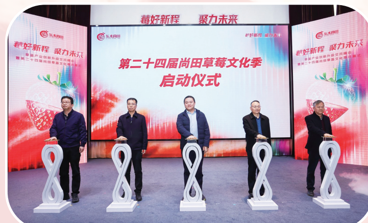
1月17日,“莓好新程 聚力未来”草莓产业创新升级交流峰会暨第二十四届尚田草莓文化季启幕

近年来,尚田优质种苗已参与四川甘洛、新疆库车等多地农业协作项目,成为促进对口协作区域发展的“共富果”。“我们不仅种草莓,更希望以草莓为媒介,将尚田打造成全国草莓产业的创新策源地、技术辐射源和品牌引领区,努力探索农业现代化发展新路径。”尚田街道相关负责人表示。