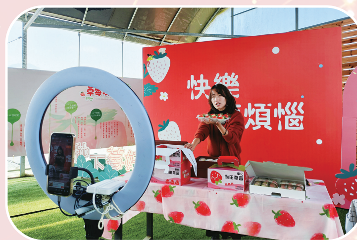
草莓销售线上直播