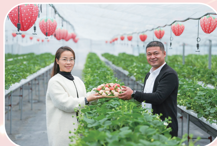
木禾土生态农场的数字化草莓大棚