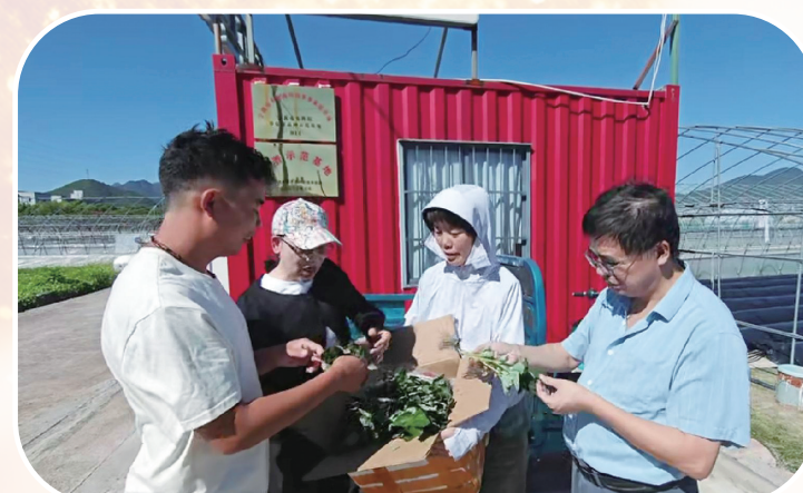
甘洛草莓种植户“迎娶”“尚田梦露”草莓种苗