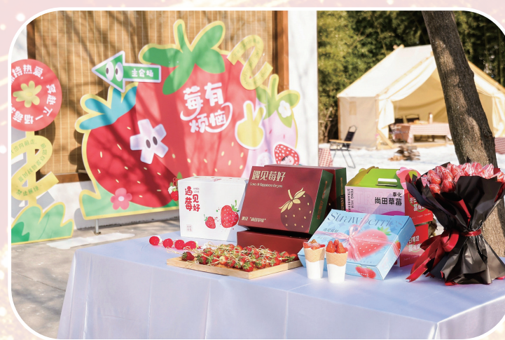
琳琅满目的草莓文创产品