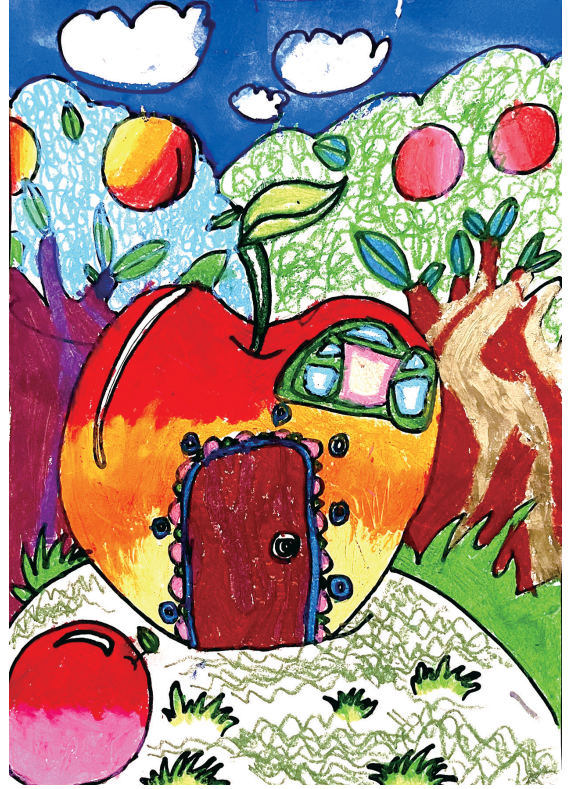
苹果屋 居敬小学303班小记者 江宸荃