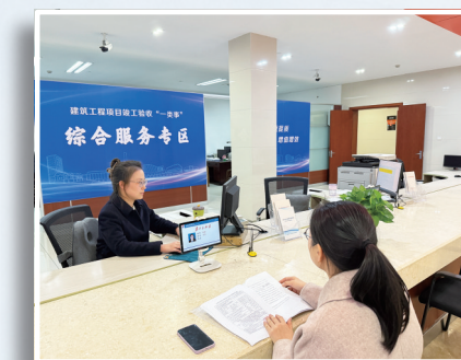
竣工验收“一类事”窗口