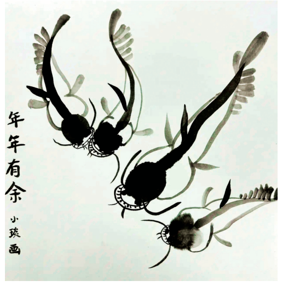
年年有余 507班小记者 汪小璇 指导老师 林甜密