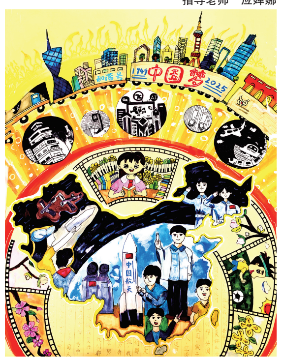
共筑新时代 同心向未来 601班小记者 洪嘉圆 指导老师 斯高伟