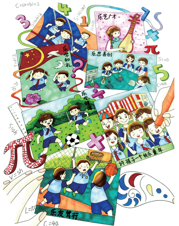
我心目中的学校 406班小记者 司徒腾远 指导老师 应婵娜