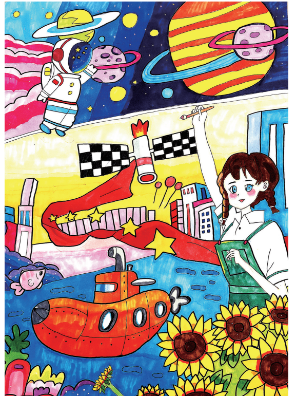
阳光下幸福成长 402班小记者 周子桐 指导老师 王雪君