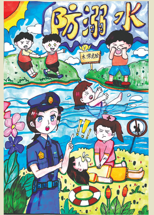
珍爱生命 预防溺水