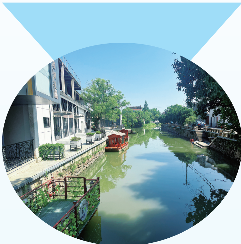
西坞街道西街河现貌

松岙镇的河道边,新修的堤防护岸用大块压顶石,摸上去粗糙却扎实。沿岸的樟树刚栽了没多久,枝叶已经能遮出一片荫。夏天傍晚,村民们会搬个小凳子坐在树下,看着清水缓缓流过,手里摇着蒲扇,聊着家常。“以前河边还有人偷偷倒垃圾,我们现在都绕着走,现在走在堤岸上,看着清水、绿树,心里都敞亮!”村民的话里满是认可。