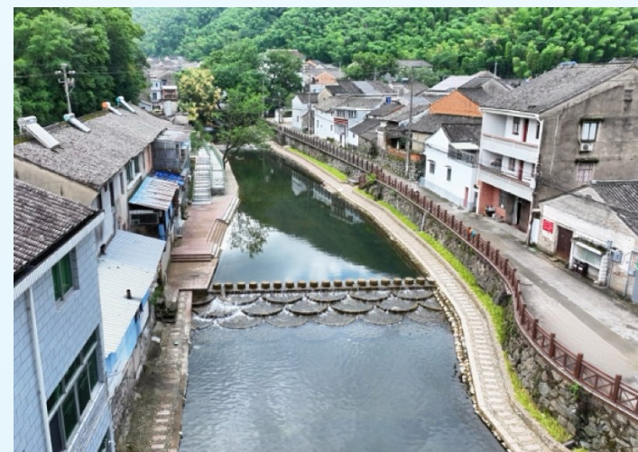
泉溪江两岸人家依水而居

从文旅旺到生活美,再到农业兴,我区的幸福河湖建设,超越了“生态修复”的单一意义,成为串联起乡村发展、民生幸福与共同富裕的“幸福源泉”,让每位村民都能从碧水清流中,尝到日子的甜滋味。