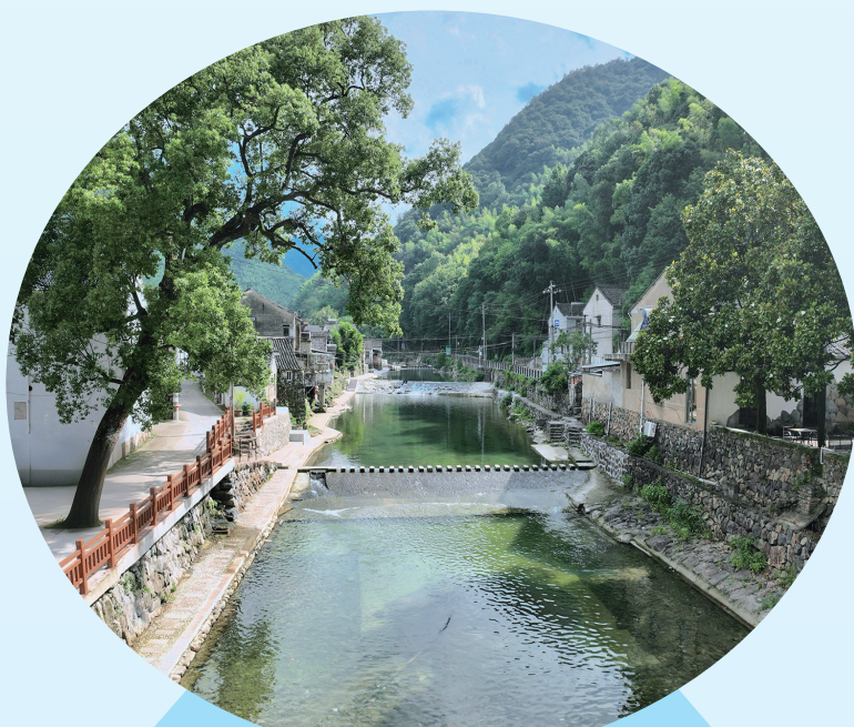
泉溪江棠岙村段亲水步道