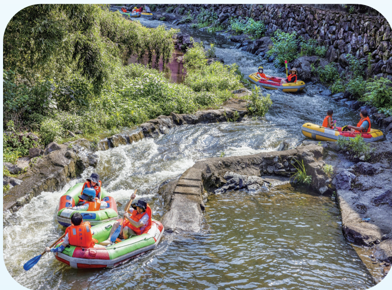
泉溪江上游夏季漂流热