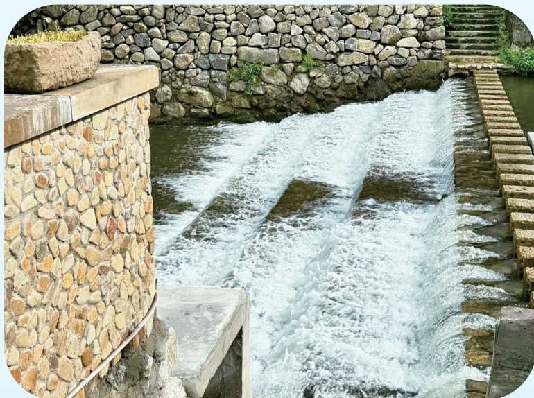
浆砌石挡墙和汀步