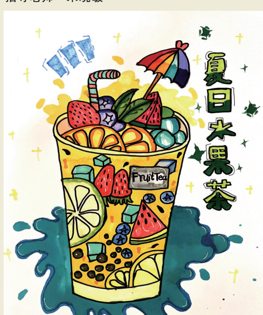
夏日水果茶 西坞中心小学305班小记者 蒋梦涵 指导老师 张淑圆