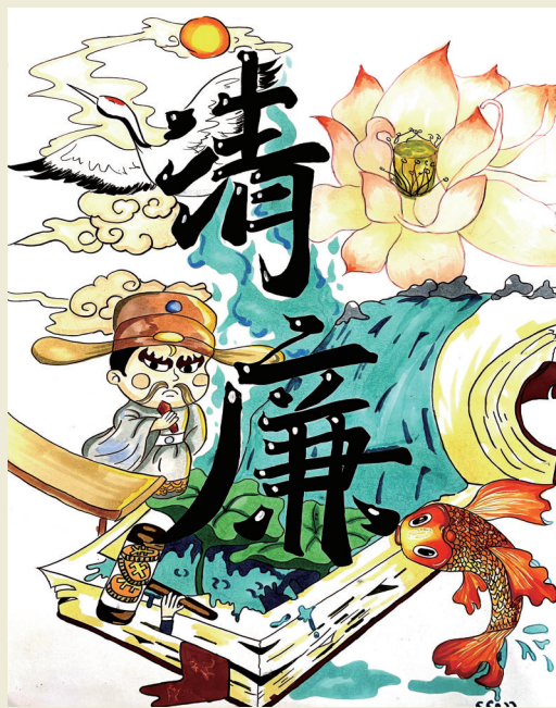
清风长存 居敬小学502班小记者 巫文泽