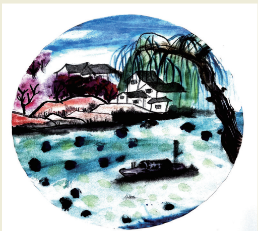
江南春色 溪口中心小学203班小记者 张乐轩 指导老师 宋晓敏