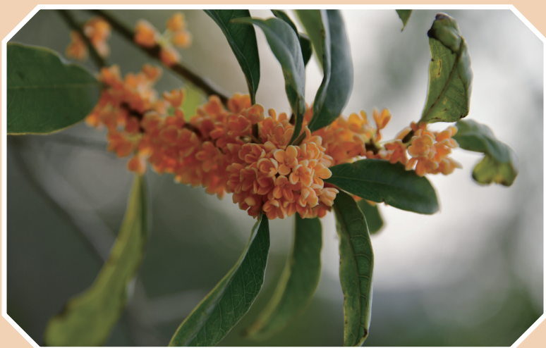
花香扑鼻