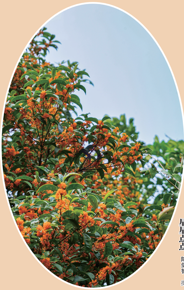
星星点点