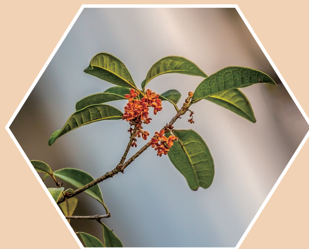
暗香浮动