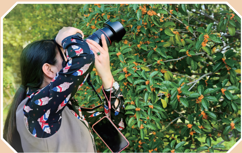
留住美好