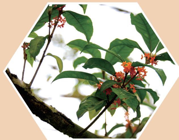
尽情芬芳