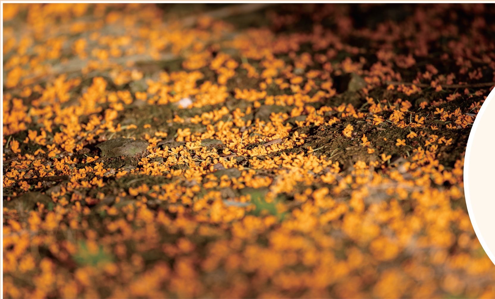
桂花落,满地秋