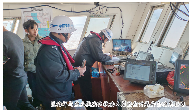
区海洋与渔业执法队执法人员登船开展安全隐患排查

聚焦渔船动态监管。主要检查船东船长是否落实进出港报告、安全设施配备、职务船员配备、值班瞭望、编组生产、穿戴救生衣等安全要求;两级应急处置中心是否落实值班值守、动态点检、预警处置、航路干预、发布海上气象等防范措施;主管部门是否落实“1510”工作机制、商渔共治、联合执法、信息共享等管理机制。自2月以来,发送各类天气预警及安全提醒信息38组,共计17151条,视频点检渔船19110艘次,同比增长33%,夜间0:00至4:00“黑色四小时”点检渔船6976艘次,同比增长49%,核查处置北斗离线、航道碍航、疲劳驾驶及无人值班瞭望等8类预警共1580个,同比增长34%。