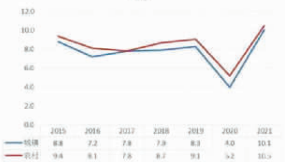
2015年至2021年前三季度居民收入增速

去年疫情以来，宁波居民收入增幅曾一度下滑，随着今年以来经济逐步复苏，宁波居民收入也呈现“V”型反弹。不过，去年疫情期间，住户存款仍保持了10%以上的增长。这或许是，在疫情防控常态化背景下，消费受到一定冲击，越来越多人重视储蓄，以应对不确定性的风险。